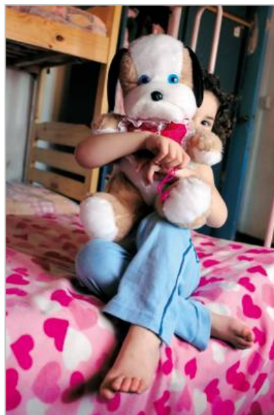
Una nena juega con su peluche en una de las habitaciones de Casa M.A.N.U.